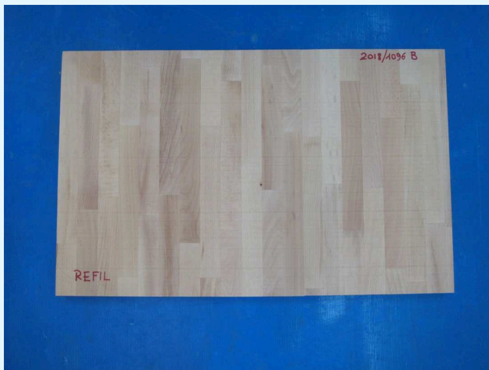
Fotografia del campione.

Il campione sottoposto a prova è costituito da un pannello in legno di faggio massello, dimensioni nominali 80 cm × 50 cm circa.