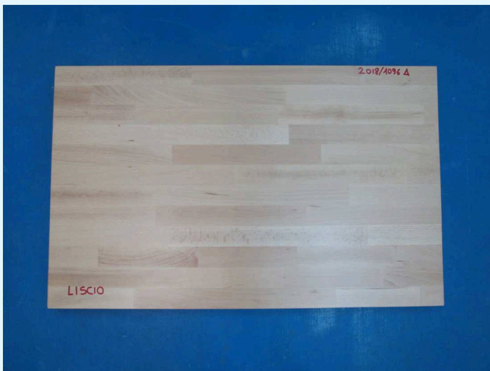
Fotografia del campione.

Il campione sottoposto a prova è costituito da un pannello in legno di faggio massello, dimensioni nominali 80 cm × 50 cm circa.